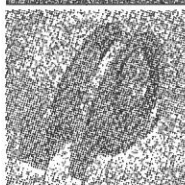
LED光にも蓄 光効果を持ち施 工性も優れる