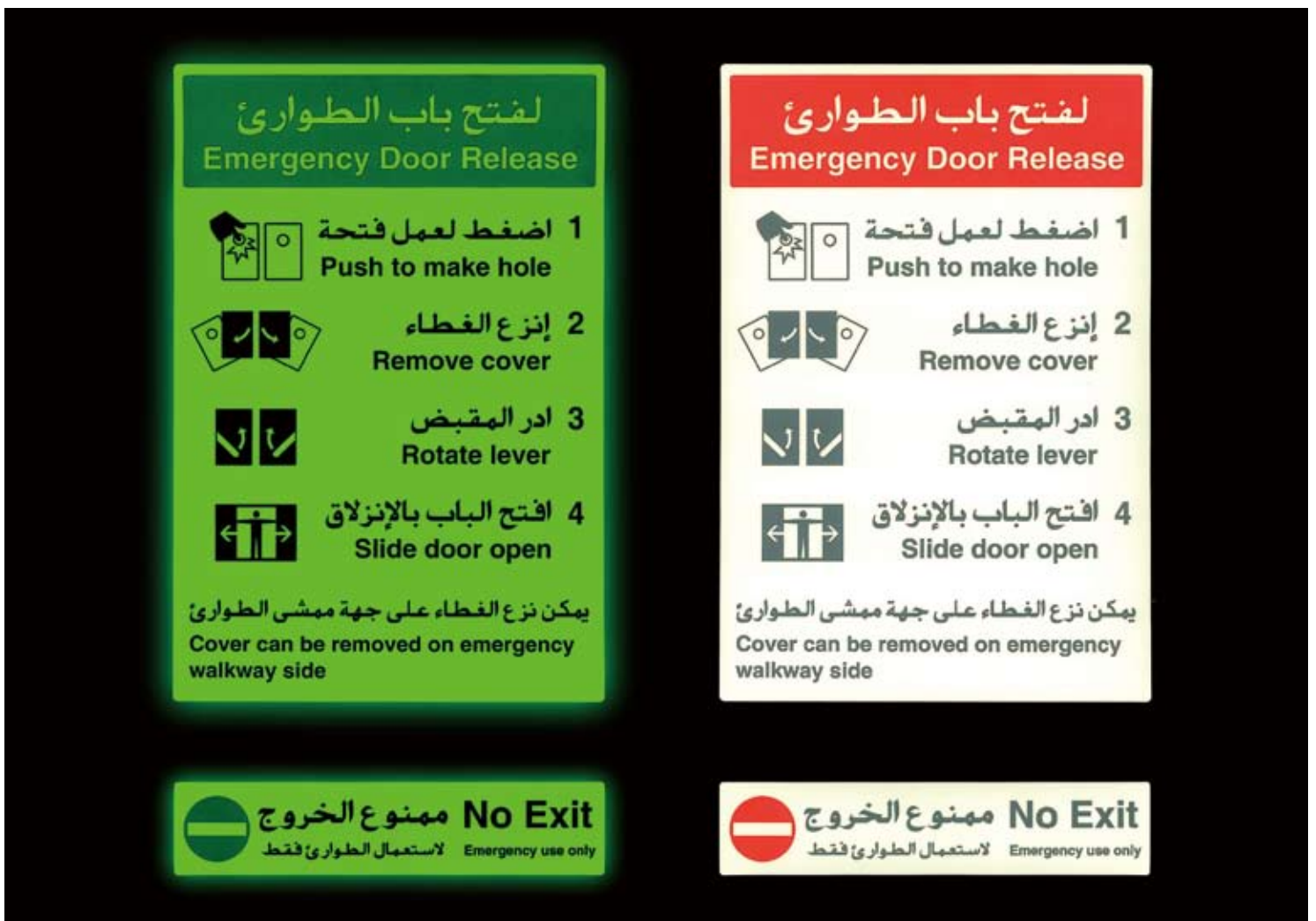
■ ドバイ空港鉄道 ■ 米国(シカゴ・ボストン)地下鉄車両内